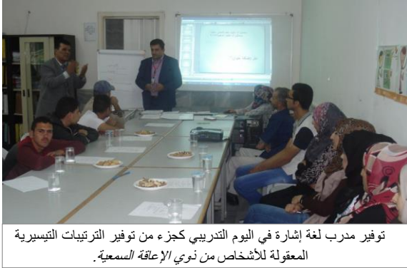
توفير مدرب لغة إشارة في اليوم التدريبي كجزء من توفير الترتيبات التيسيرية المعقولة للأشخاص ذوي الإعاقة السمعية.

"أنت عامل وتتمتع بكافة الحقوق الواردة في القانون وفي التشريعات ذات العلاقة"؛ انطلاقاً من هذا المبدأ وضمن الجهود الرامية إلى زيادة وعي العمال ذوي الإعاقة بحقوقهم الواردة في التشريعات، تم عقد ورشة عمل يوم الأحد الموافق 2016/11/1 في قاعة نقابة الغزل والنسيج للعاملين ذوي الإعاقة في منطقة الضليل الصناعية.