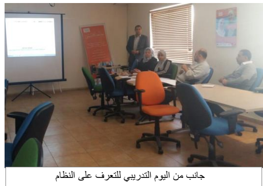
جانب من اليوم التدريبي للتعرف على النظام

تم اطلاع المشاركين في كيفية استخدام النظام والذي يساعدهم في عملية الربط بين الباحث من ذوي الإعاقة وفرصة عمل تناسب مهاراته. وبذلك يتم توسيع خيارات الشركات الباحثة عن العمالة المؤهلة حسب التخصصات المطلوبة.